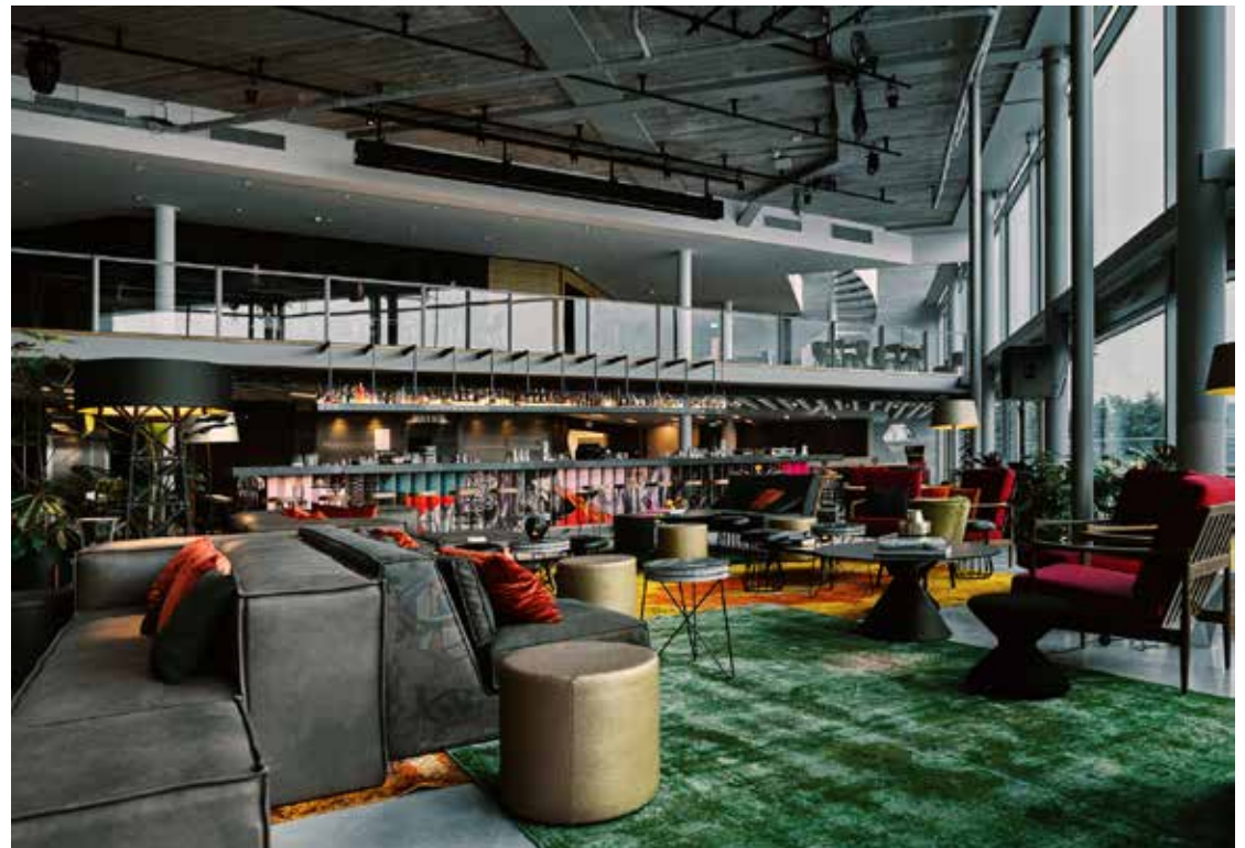
FOTO LINKS De A'DAM Toren. In wat ooit een introvert kantoorgebouw was, vind je nu een bruisende mix van muziekbedrijven, horeca en entertainment. (Foto: Martijn Kort)

FOTO BOVEN De LookOut op het dak van de toren, met daarop de hoogste schommels van Europa: OverTheEdge, ontworpen door NorthernLight. (Foto: Martijn Kort)