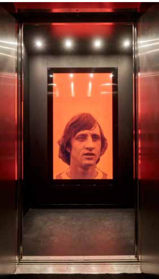
FOTO BOVEN LINKSBOVEN De liften hebben ieder hun eigen soundtrack.