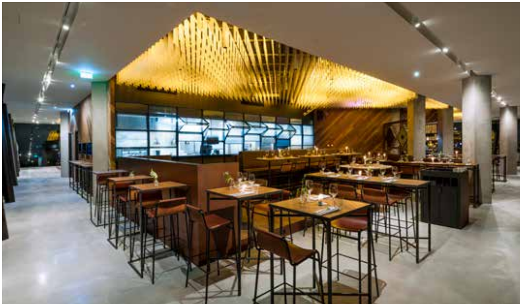
FOTO LINKSBOVEN The Loft is een dubbelhoge ruimte die van TANK een luxueuze uitstraling kreeg. Hier afgebeeld de 'Event Space' op de zestiende verdieping.