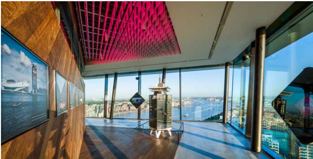
FOTO BOVEN De Lookout biedt behalve de hoogste schommels van Europa ook een interactieve expositie over Amsterdam.